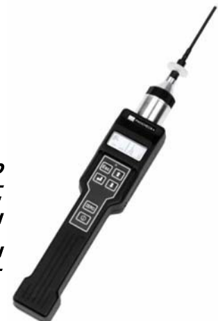
Rilevatore PID utilizzato per l'esecuzione di rilievo di V.O.C. (Componenti Organici Volatili) eseguita ad ogni prelievo di campione di terreno.