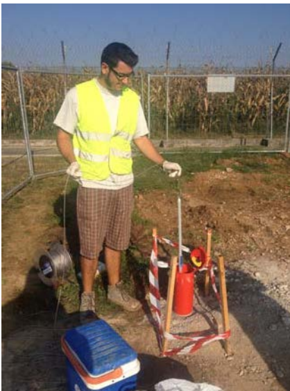
Prelievo tramite lo strumento baller, di campioni d'acqua (foto sottostante) sigillati all'interno di bottiglie ambrate.