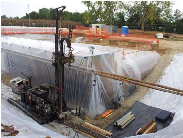
Esecuzione di sondaggio a carotaggio continuo ambientale.

LAVORI: indagini geognostiche ambientali: sondaggi a carotaggio continuo con prelievo campioni di terreno da sondaggio e da cumulo, installazione di piezometri e prelievo acque, misura del livelli di C.O.V. (Composti Organici Volatili) Anno 2013. FINALITA': controllo dello stato d'inquinamento di terreni e acque all'interno del deposito carburanti off-base per messa in sicurezza degli impianti.