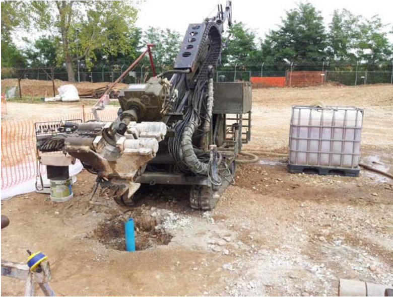
Installazione di piezometro tipo Norton all'interno del foro di sondaggio.