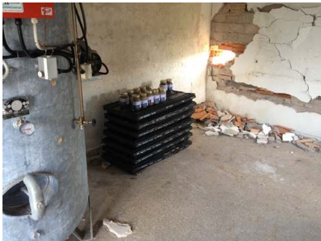
Cassette catalogatrici e campioni di terreno rimani e gglati prelevati dai sondaggi ambientali.