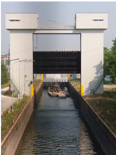
Penetrometro Pc90 su pontone galleggiante: superamento chiuse dell'avanconca del porto di Cremona. Prove penetrometriche CPT in alveo fluviale.

L'ubicazione delle indagini era in alveo pertanto i lavori si sono svolti su pontone galleggiante. Sia le prove penetrometriche statiche che i sondaggi a carotaggio continuo hanno previsto l'utilizzo di un tubo cavo di rivestimento per il corretto centramento e la stabilizzazione delle aste penetrometriche e di perforazione. Tale rivestimento è stato utilizzato nel tratto sommerso per una lunghezza variabile, compresa tra la base del pontone e il fondo fluviale. Durante i sondaggi a carotaggio sono stati prelevati campioni indisturbati per l'esecuzione di prove di laboratorio geotecnico sui terreni prelevati.