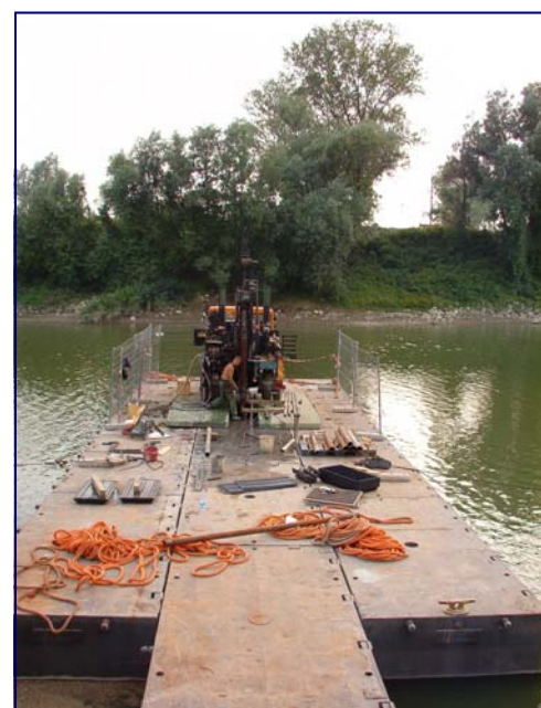
Penetrometro Pc90 e materiale per esecuzione sondaggio a rotazione e prova penetrometrica CPT in alveo fluviale.